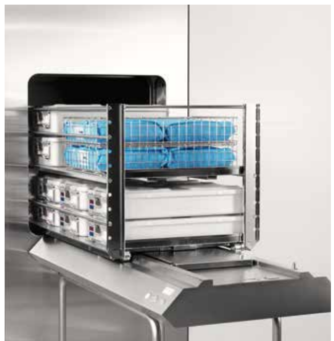
Chargeur et déchargeur automatique pour les supports à étagères/embases (GL64SR).