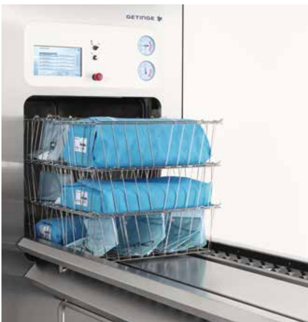
Chargeur et déchargeur automatique pour les paniers (GL64B).

Nous proposons des systèmes de manipulation complets, économiques et ergonomiques pour les paniers ainsi que pour les conteneurs. Qu'ils soient automatiques ou manuels, nous adaptons chaque détail de nos systèmes pour faciliter le travail et le rendre plus efficace dans toutes les unités centrales de stérilisation, que vous ayez un stérilisateur ou dix.