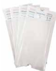
Sachets de stérilisation plats Getinge Pack

Les soudeuses rotatives Getinge intuitives améliorent l'efficacité de l'opérateur en fournissant un scellage de grande qualité. Elles sont conçues pour sceller de manière efficace et fiable les rouleaux de gaine et sachets en papier médical ou en matière non tissée.