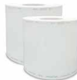
Rouleaux de stérilisation plats Getinge Pack