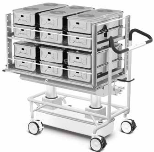
Chariots de chargement/déchargement Smart AHT.

La solution de chargement à point unique innovante et automatique de Getinge améliore le rendement des unités centrales de stérilisation dotées de plusieurs stérilisateurs. Dès qu'un stérilisateur est disponible, une nouvelle charge est lancée automatiquement, ce qui permet une disponibilité optimale et une utilisation complète des ressources.