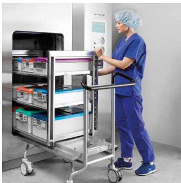
Chariot SMART Getinge pour le chargement et le déchargement.

Avec le stérilisateur Getinge GSS610H, vous avez le choix entre un système de chargement automatique ou manuel.