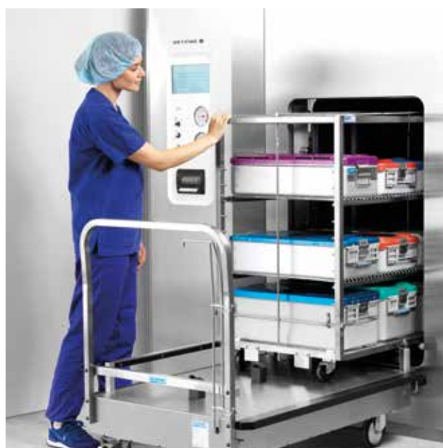
Le Getinge GSS610H est compatible avec le système de chargement Kangourou d'Hupfer.