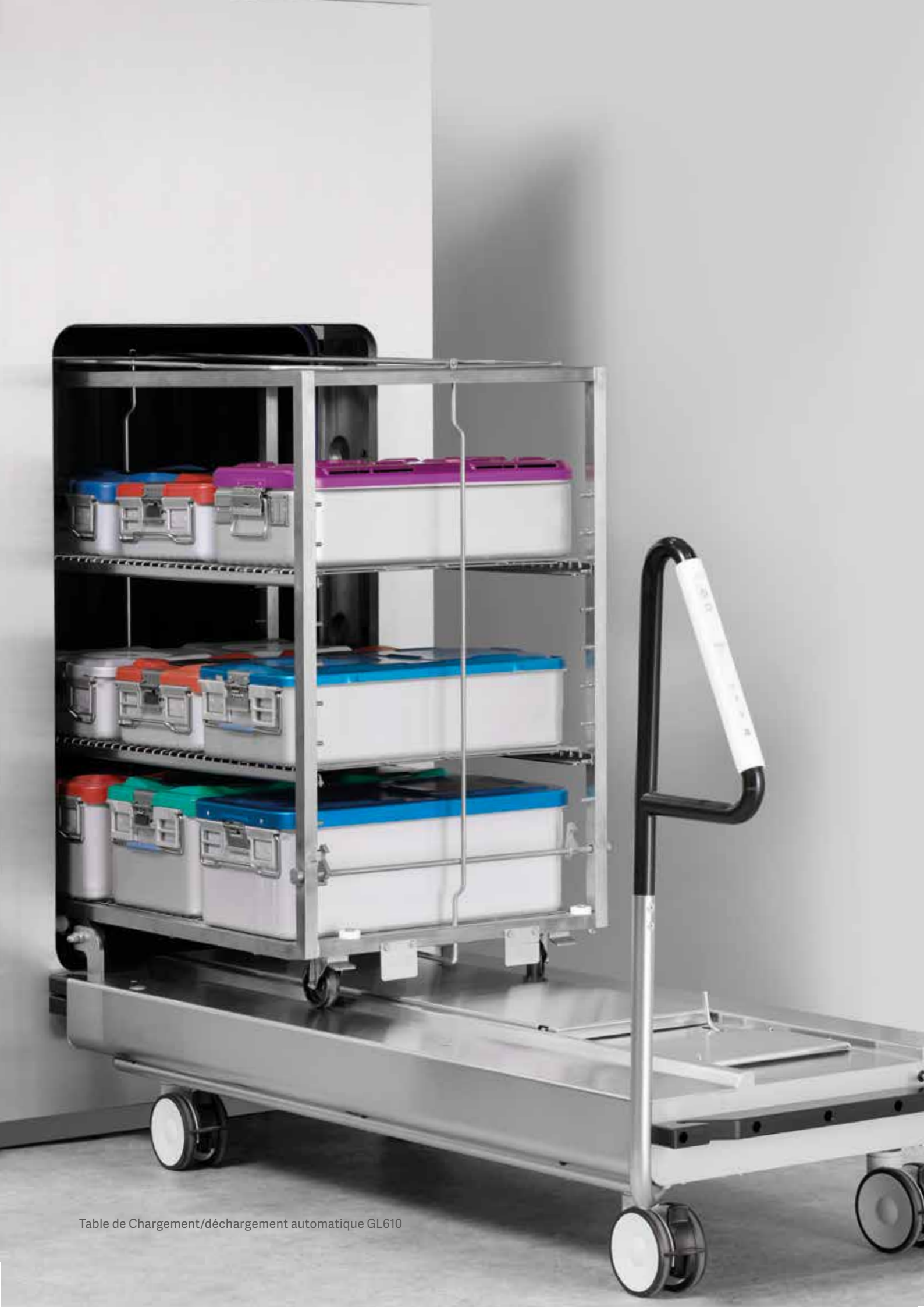
Table de Chargement/déchargement automatique GL610