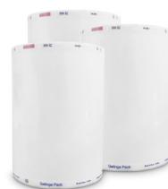
Rouleau de stérilisation DuPont™ Tyvek®.