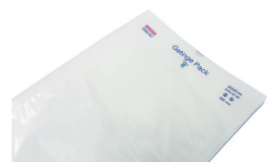
Sachet de stérilisation DuPont™ Tyvek®.