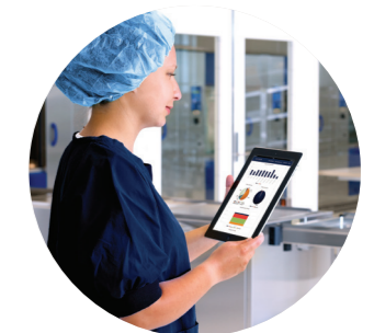
Getinge Online Digitaler Service