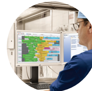
myMedis Krankenhausweite Planung und Dokumentation

– unterstützt die Prozesse in verschiedenen Bereichen des ambulanten OP-Zentrums